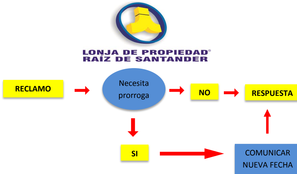
Figura 2. Procedimiento reclamo